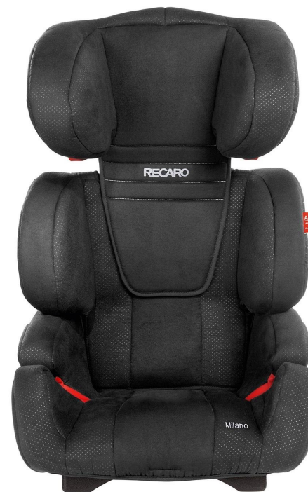
Krēsla BLACK 2013