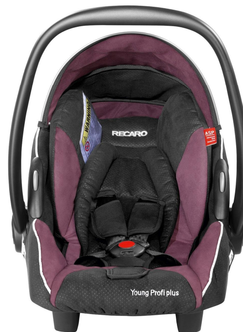
Krāsa VIOLET 2013