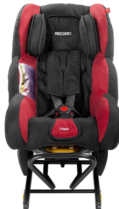
Krāsa CHERRY 2013